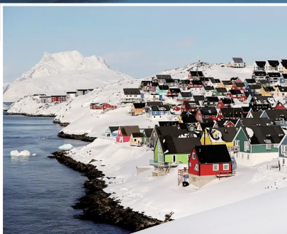
格陵兰岛首府努克景色

在此前达成的欧美贸易协议中，欧盟需取消对美国产工业品的关税并为美海产品和农产品提供优惠市场准入，以换取美国对大多数欧盟输美商品征收15%的关税。《政治报·欧洲版》网站17日报道，有消息证实，欧洲议会不会推进对该协议的批准程序，这将令欧美贸易战前景充满不确定性。