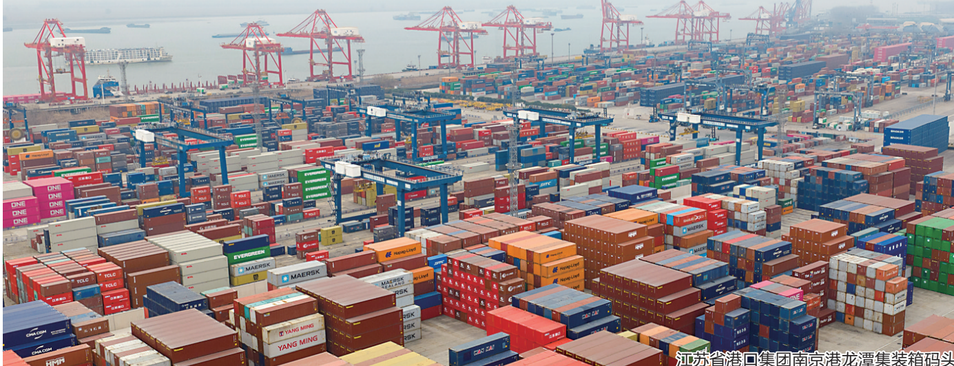
江苏省港口集团南京龙潭集装箱码头