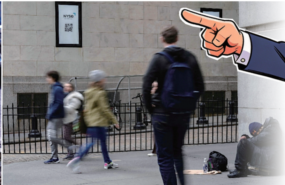
一名无家可归者在美国纽约证券交易所外休息