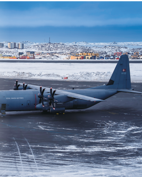
停在格陵兰岛的丹麦空军“超级大力神”运输机