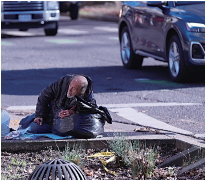
无家可归者躺在美国俄勒冈州波特兰街头