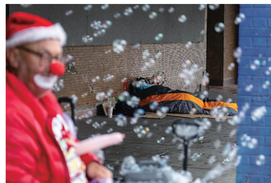
无家可归的美国人露宿街头

美国的宏观经济数据呈现出一种增长幻象,掩盖了社会中下层群体的生存困境。隐形的“斩杀线”,折射出的不仅是美国普通民众面临的民生之困,更有可能演变成一场对美国社会制度的信任危机。