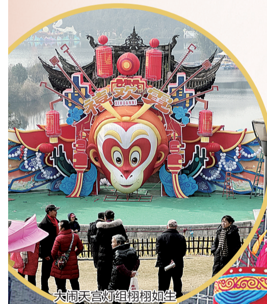
大闹天宫灯组栩栩如生