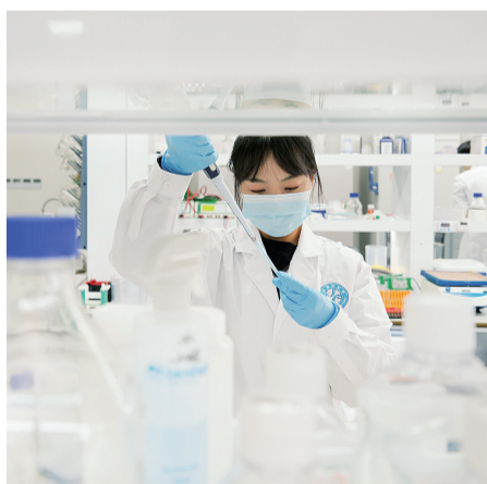
川渝联合打造金凤病理实验室

2024年，四川零部件供应商与赛力斯配套金额184亿元左右，同比增长约350%。初步形成从铝合金新材料生产、模具开发到轻量化零部件与整车生产的轻量化汽车生产链条，提升了“重庆造”智能网联新能源汽车市场竞争力，吸引更多优质企业加入供应链，