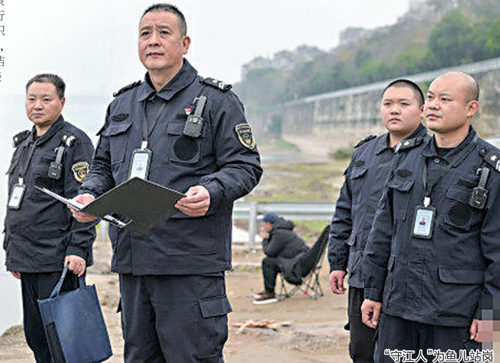
“守江人”为鱼儿站岗