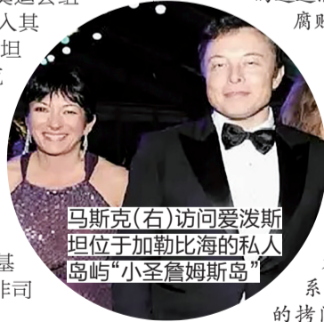
马斯克(右)访问爱泼斯坦位于加勒比海的私人岛屿“小圣詹姆斯岛”

在英国，压力转移到了首相斯塔默及其所在的工党身上。前商务大臣、资深议员彼得·曼德尔森勋爵因与爱泼斯坦的深厚关联(包括被披露可能接收过7.5万美元汇款)以及文件中出现的其衣着不雅的照片，在文件公布后宣布退出工党，以避免给政党带来“进一步的尴尬”。然而，他仍保留着上议院议员和枢密院顾问的爵位身份，这引发了要求剥夺其爵位的呼声。斯塔默因其最初任命曼德尔森为驻美大使的决定，以及其办公室主任与曼德尔森的友谊而面临党内压力。甚至2028年洛杉矶奥运会组委会主席凯西·沃瑟曼也卷入其中，因其在2003年与爱泼斯坦已定罪的同伙吉丝兰·马克斯韦尔之间的调情邮件被公开而被迫道歉。这些接连不断的辞职与道歉，构成了一幅尴尬的图景：权力的关联一旦被阳光照亮，便迅速转化为需要切割的政治负担。然而，这种切割多是基于舆论压力和形象维护，而非司法定罪。