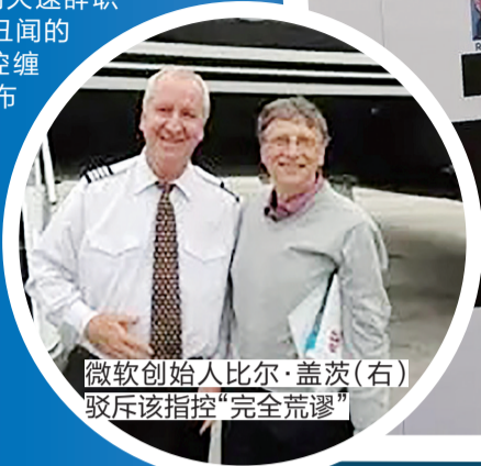
微软创始人比尔·盖茨(右) 驳斥该指控“完全荒谬”

美国司法部于当地时间1月30日公布了已故性犯罪者杰弗里·爱泼斯坦案的最后一批调查文件，总量超过300万页。这批海量档案犹如一面镜子，映照出横跨大西洋两岸的政、商、王室精英与这名罪犯之间复杂而紧密的联系网络。从紧急回应的科技巨富到火速辞职的欧洲政要，从深陷照片丑闻的前王室成员到被匿名指控缠身的美国总统，文件的公布不仅未能平息公众质疑，反而因大量内容被涂黑、受害者信息意外泄露以及司法部明确表态“难以追加指控”而引发更强烈的信任危机。此案已超越单纯的司法范畴，成为一场对权力体系透明度与问责制的公开拷问。