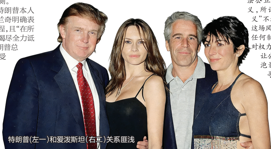
特朗普(左一)和爱泼斯坦(右二)关系匪浅