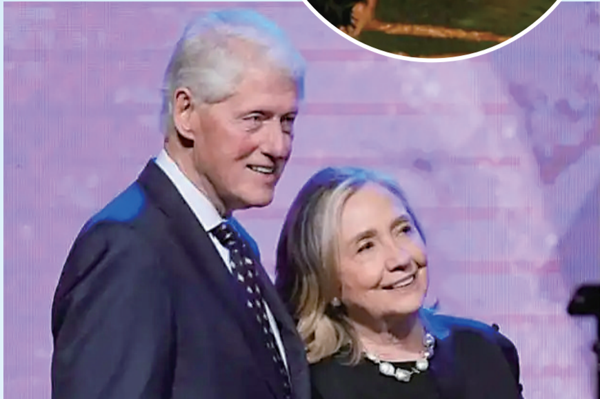
克林顿及其妻子希拉里

挪威广播公司1日称，新公布的爱泼斯坦案文件中有数百份提到了挪威王储妃梅特·玛丽特。玛丽特曾与爱泼斯坦在多封电子邮件中讨论爱泼斯坦的“猎艳”等行为，还多次约定会面。玛丽特1日发表声明，表示对与爱泼斯坦的接触“感到后悔”，并称自己“当时判断失误，令人难堪”。