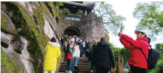
钓鱼城景区人流如织

如果说钓鱼城免费是“引客之钥”，那“来合川过年”系列活动就是串起全城的“消费链条”！活动围绕游名城、品美食、买年货、忆年味四大板块，推出10项子活动，精准对接游客多元需求，让免费政策