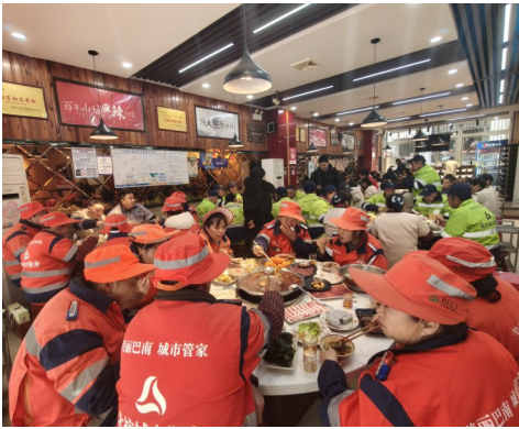
活动现场,年味十足。

是另一番温馨景象。20位环卫工人和外卖小哥围坐一堂,在充满怀旧风情的老街院落里,感受久违的松弛与温暖。桌上摆的是地道“年味”:巴县杜鹃鱼、浓汤虾胶秀珍菇边炉,还有创新的水洞豆花鱼。同时,现场还安排了互动环节,让这些平日里默默奔波的城市守护者,有了轻松交流、分享故事的时刻。餐厅负责人表示:“他们守护城市整洁与便利,我们只想用一桌家乡味,守护他们片刻的温暖与团圆。”