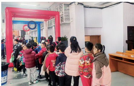
孩子们排队体验无人机足球