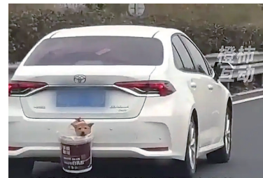
部分网友带宠物回家的视频截图

近日，多地出现带宠物回家过年时，主人把狗挂在车尾或放在车顶的现象。其实这种行为不仅十分危险，还违反交通法规！