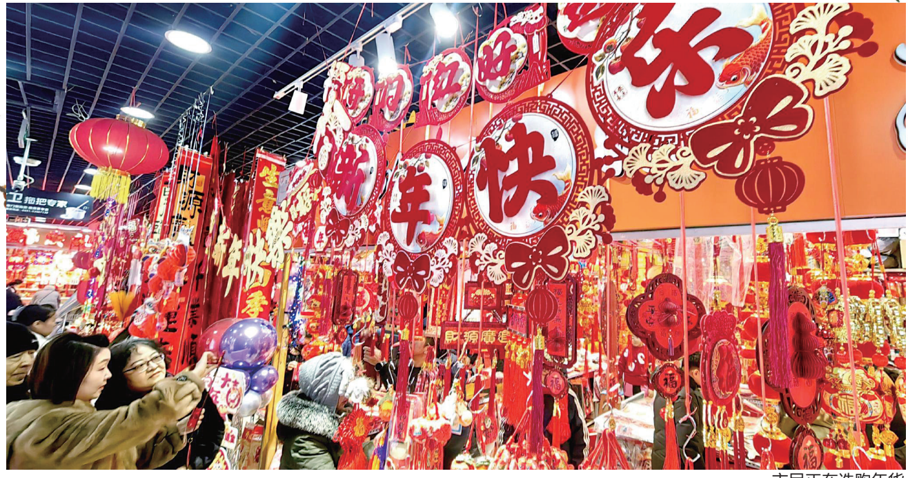
市民正在选购年货