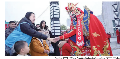
演员和过往旅客互动

“一江春水贯巴蜀,万里云程共此时。”启动仪式上,重庆市文化旅游委副主任朱茂表示,根据计划,2026年“巴蜀文化旅游走廊”主题列车将于3月初正式上线运行。“只要大家登上列车,就会感受到这是一趟感知巴蜀风韵、体验潮流生活的文化之旅,巴蜀文化的深厚底蕴、时代风采