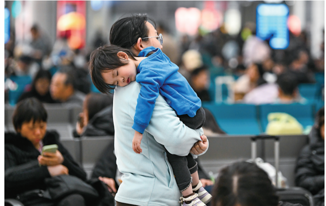
▶2月23日，全国铁路迎来返程客流最高峰，旅客在重庆北站候车大厅等待乘车。