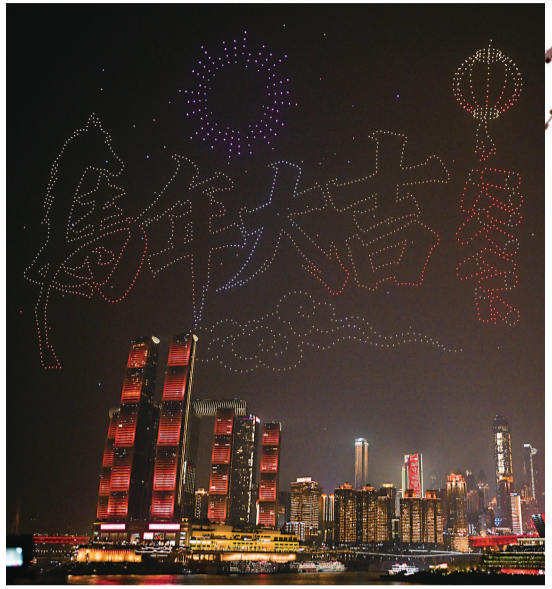
▲大年初一，“新韵重庆”无人机灯光秀在重庆夜空上演。

昨天，正月初七，春节假期画上句号。本报以镜头为笔，定格山城重庆及神州大地的新春瞬间，细细品味春节里的酸甜苦辣。