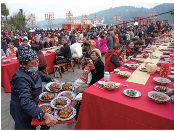
▲2月16日，重庆市永川区松溉古镇，千家宴活动现场，大家体验中国年味。