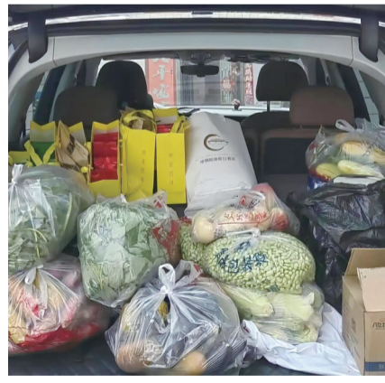
◀春节返程路上，网友在社交平台上晒出了自己离家的行囊，大包小包、瓶瓶罐罐，塞得满满当当。