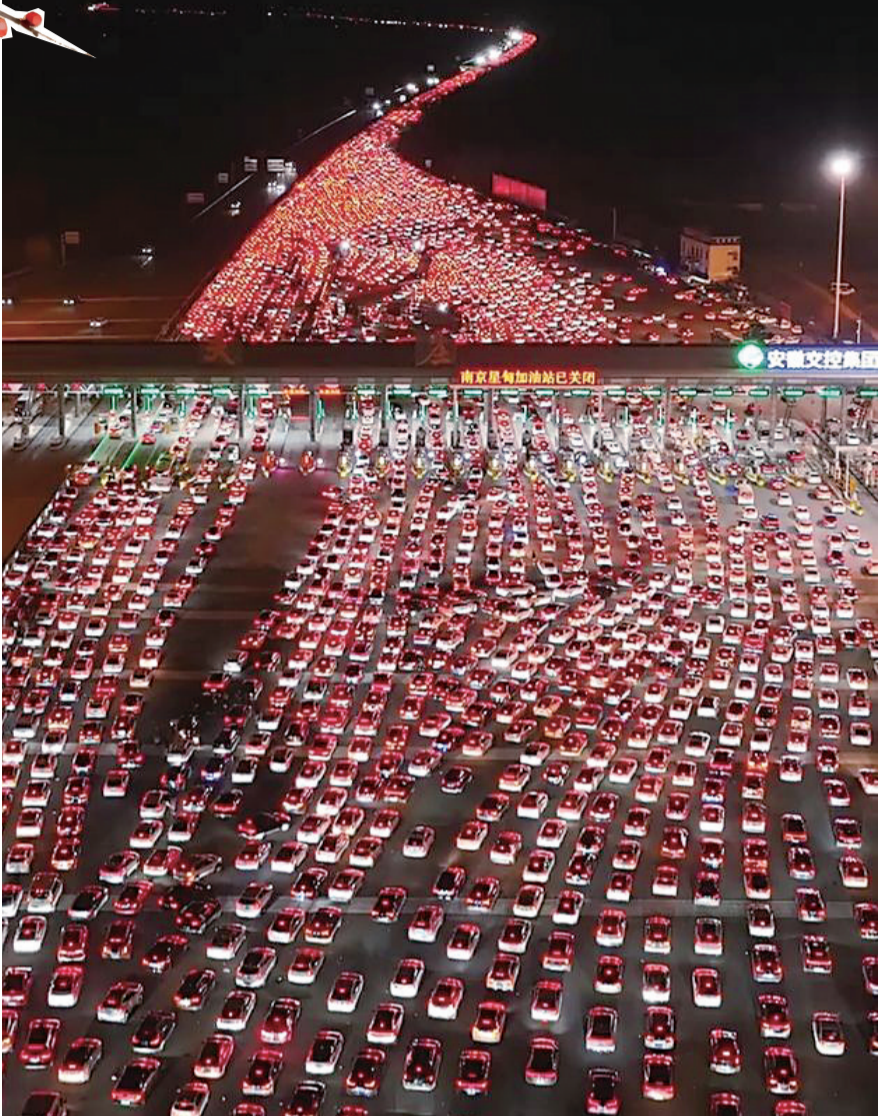
▲中国最大高速收费站——位于安徽省全椒县、毗邻皖苏两省交界的吴庄收费站，36个车道被挤满，车灯连成星河。