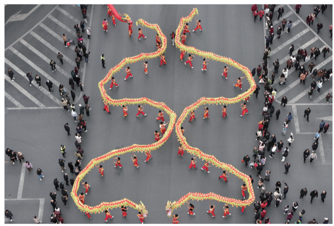
▲2月17日，重庆市铜梁区，龙舞春节大巡游活动现场。