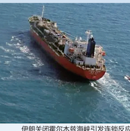
伊朗关闭霍尔木兹海峡引发连锁反应

关”的油轮据称被击中“正在沉没”。高盛在最新报告中将原油价格的实时风险溢价定为18美元/桶。更悲观的预测来自分析机构Kpler：油价可能冲到90美元，如果封锁持续，突破100美元也并非天方夜谭。《经济学家》甚至警告，这可能引发“多年来最严重的石油冲击”。油价一涨，连锁反应就来了。航空公司的燃油成本要涨，化工企业的原料要贵，泰国已紧急暂停石油出口，日本担心经济受“致命打击”。有分析师将高油价比作“特朗普的阿喀琉斯之踵”——他曾向选民承诺低油价，如今却不得不面对通胀反弹的风险。