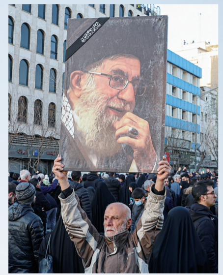
民众在伊朗首都德黑兰集会，哀悼伊朗最高领袖哈梅内伊。

就在美以与伊朗战事胶着之际，欧洲的人局信号让局势更加复杂。英国、法国和德国领导人1日晚发表联合声明，字里行间透露出军事干预的意图。声明称，三国可能对伊朗采取“必要且相称的防御行动”，以摧毁其发射导弹和无人机的能力，并已同意就此与美国以及受袭地区盟友合作。英国首相斯塔默当晚进一步表态，英国已同意美国使用英方军事基地用于“特定且有限”的防御目的。他透露，海湾国家已要求英国加大防御力度，英军战机已在该地区执行任务并成功拦截了伊朗袭击。法国外交部长巴罗透露，法国准备参