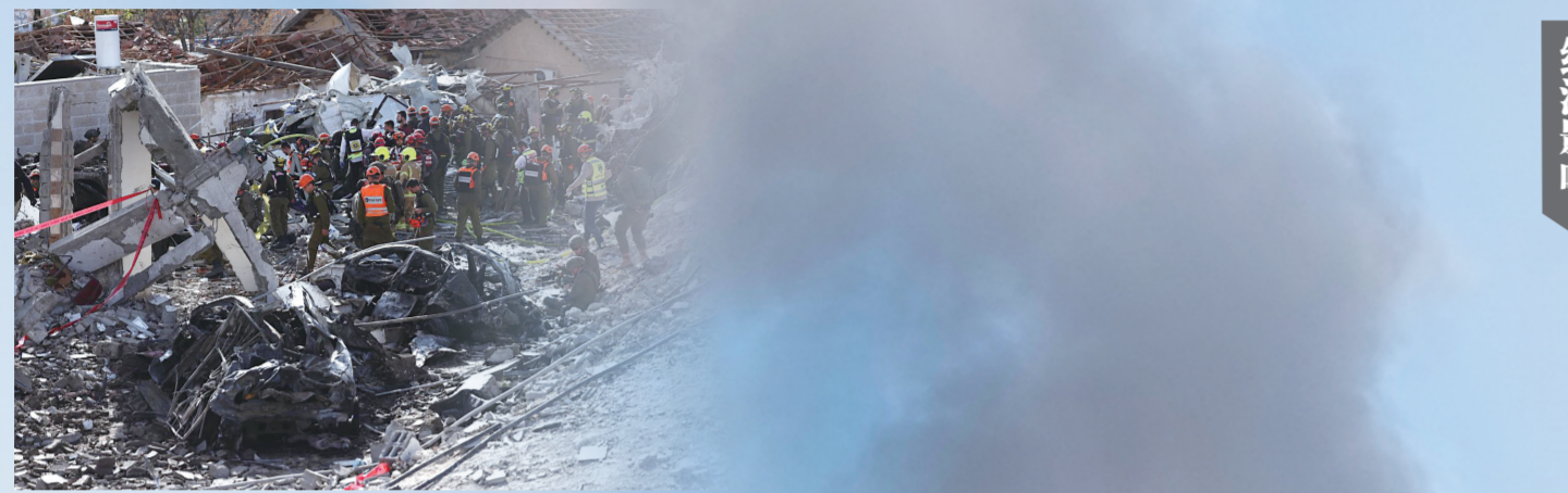
这是3月1日在耶路撒冷西部城镇贝特谢梅什拍摄的导弹袭击现场

2月28日美以对伊朗发动突袭导致最高领袖哈梅内伊遇害后，战火迅速蔓延至整个波斯湾。过去48小时，从迪拜的帆船酒店到科威特的美军基地，从多哈的天空到巴林的第五舰队驻地，爆炸声此起彼伏。面对美以持续加码的攻势，伊朗展开多轮猛烈反击，誓言绝不与美国谈判，并表示做好打长期战争的准备。与此同时，英国、法国和德国发表联合声明，称可能对伊朗采取“必要且相称的防御行动”，英法德的表态意味着地区冲突或将进一步升级，国际社会对局势恶化的担忧持续加剧。