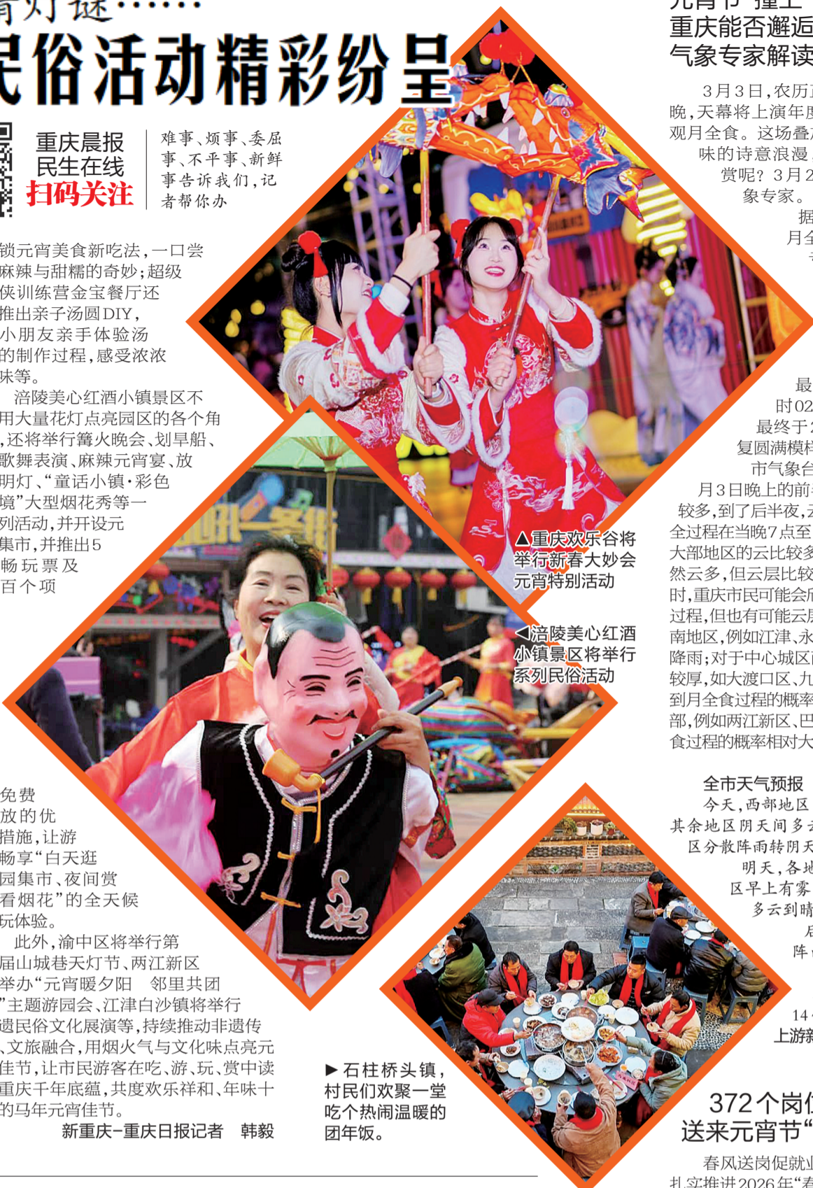
重庆欢乐谷将举行新春大妙会元宵特别活动