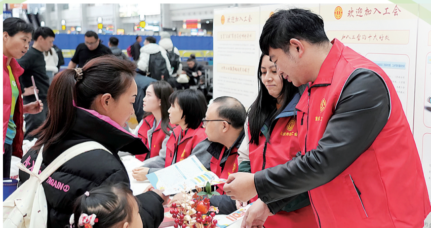
重庆市总工会在重庆北站开展“春风送法律·平安万里行”普法宣传活动

3月3日,重庆北站候车厅人头攒动。伴着元宵佳节的喜庆氛围,重庆市总工会正式启动2026年“春风送法律·平安万里行”服务活动,把实用的法律知识和工会暖心服务,送到外出务工的农民工、新就业形态劳动者及其随行家属身边。