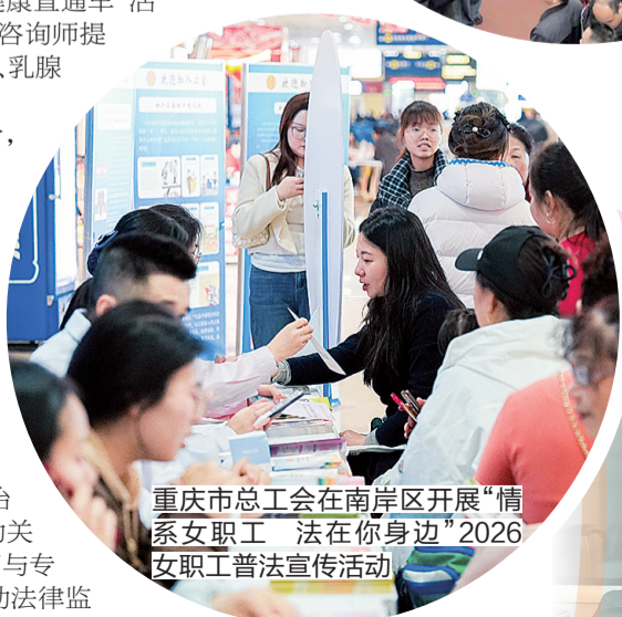
重庆市总工会在南岸区开展“情系女职工 法在你身边”2026年女职工普法宣传活动

据悉,市总工会将指导各级工会组织于3月份在全市范围内开展普法宣传活动,活动内容围绕三个方面展开:一是广泛开展普法宣传到基层活动。围绕《中华人民共和国妇女权益保障法》《女职工劳动保护特别规定》等法律法规,面向用人单位、基层一线职工及新就业形态劳动者等重点群体,开展互动式、场景化普法宣传;二是充分运用法治方式协调劳动关系。贯彻落实党中央关于完善劳动关系协商协调机制的要求,加强对女职工专项集体协商与专项集体合同工作的分类指导;三是着力强化工会劳动法律监督。加强与法院、检察院、司法、人社、妇联等部门协同配合,深入企业、园区等开展“送法上门+法律服务”活动。聚焦就业性别歧视、生育待遇不落实、特殊劳动保护不到位等问题,开展专项监督检查,切实维护女职工合法权益。