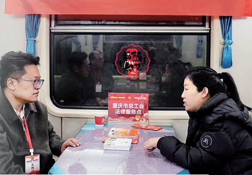
重庆市总工会在列车车厢开展“春风送法律·平安万里行”普法宣传活动