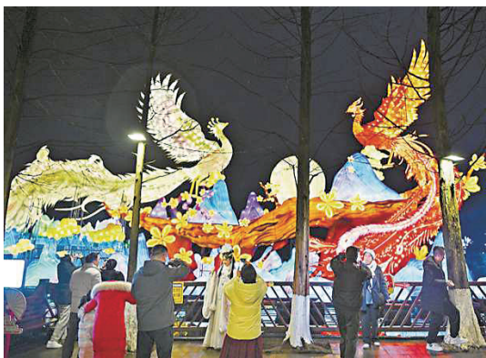
“禧欢露”园博园大型水上灯会