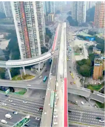
科学城隧道工程建设现场

3月16日，市住房和城乡建设委发布消息，今年我市大力实施城市交通基础设施建设提升行动，开年之初，中心城区一批路桥隧项目接连传来好消息。备受市民关注的科学城隧道、黄桷坪长江大桥、龙兴片区下穿隧道等重点工程稳步推进，关键节点取得新突破，将进一步优化城市路网结构、缓解交通压力、助力区域协同发展。