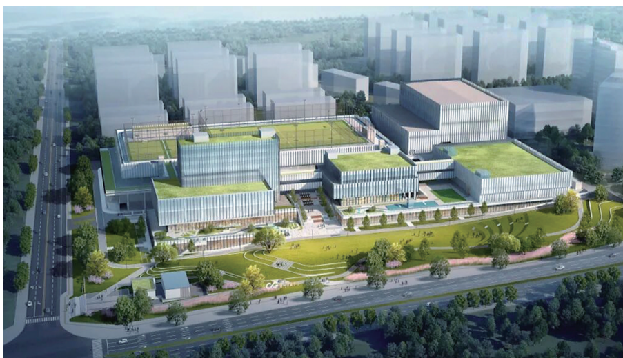
重光体育中心建成后的效果

3月16日，记者从两江新区住建委获悉，重光体育中心建设取得关键进展，综合A馆外立面玻璃幕墙安装基本完工，实景样板间同步建成，项目正式从主体施工转入运营准备阶段，将于年内与轨道15号线同步投用。