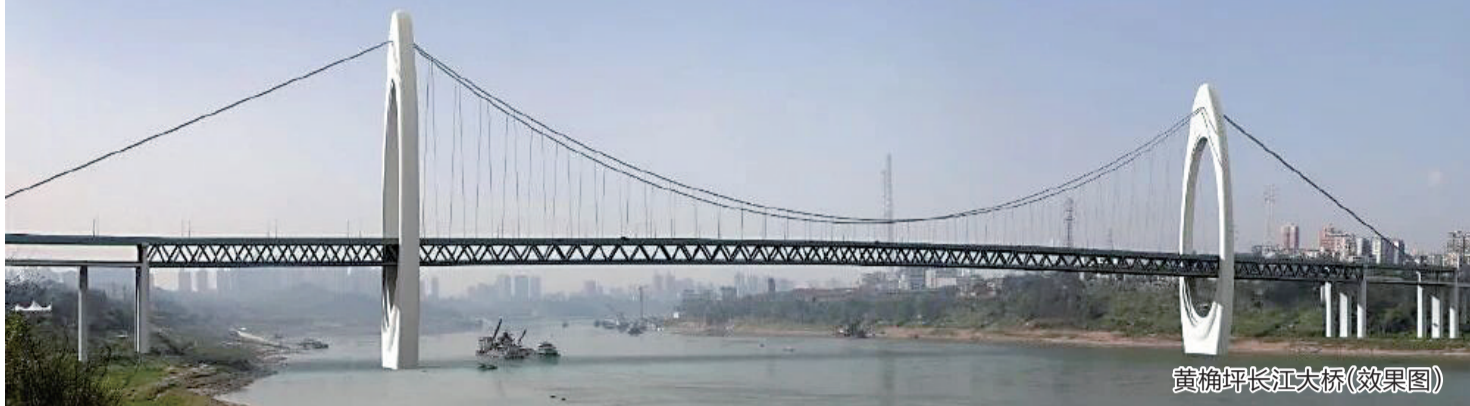
黄桷坪长江大桥(效果图)