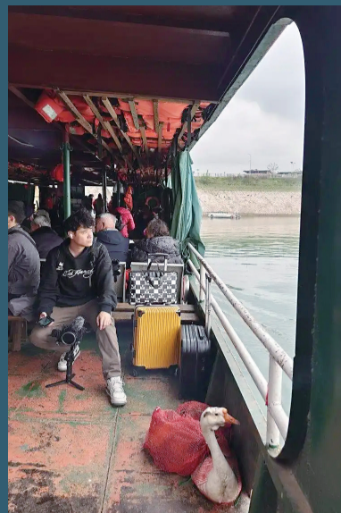
新“渝忠客2180”进行了全面升级