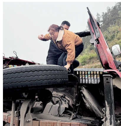
救出货车上的女子