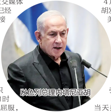
以色列总理内塔尼亚胡

此前，美国国防部3日公布数据称，共有365名美军人员在对伊朗的军事行动中受伤。死亡人数仍为13人，包括6名在科威特遭伊朗袭击身亡的军人，1名在沙特阿拉伯受伤后不治身亡的军人，以及在一架美军加油机坠毁事件中身亡的6人。