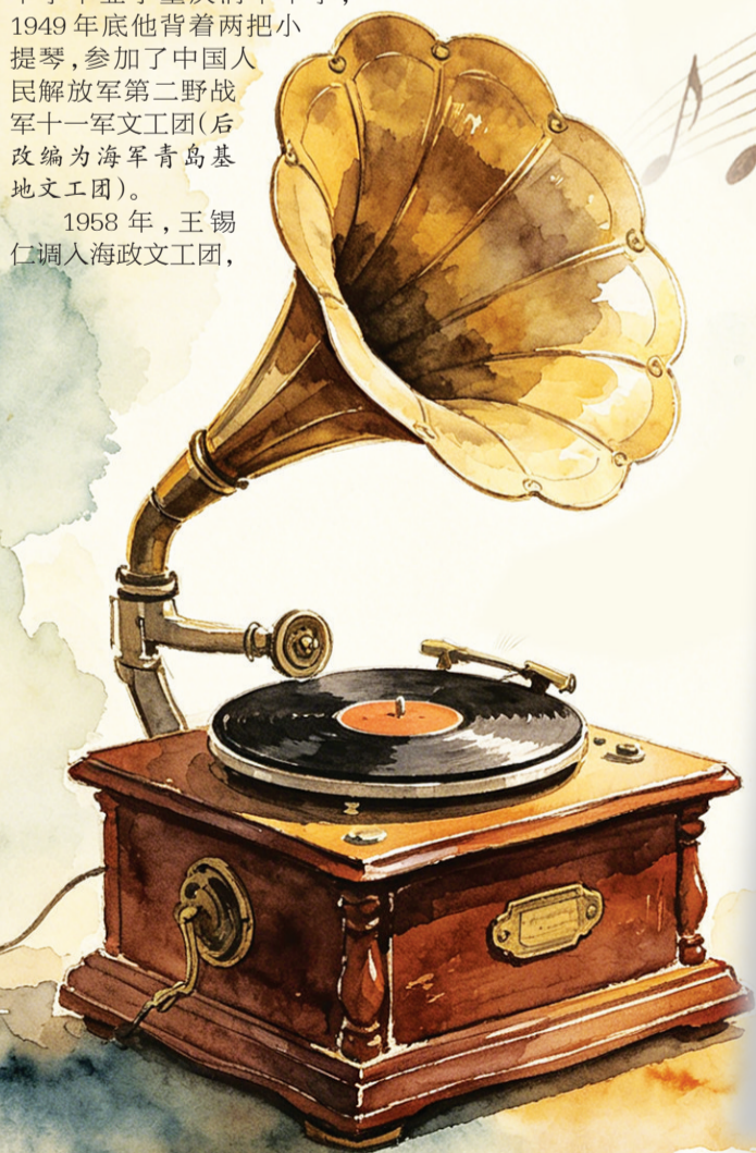
为家乡提词“情系白沙”

2010年2月11日，王锡仁不幸因病离世，但他创作的歌曲具有永恒魅力，成为永不消逝的天籁之音。