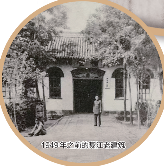
1949年之前的綦江老建筑

丰都、南川、彭水。省军委书记李鸣珂到涪陵主持工作，与陈治钧等五人组成中共涪陵特别行动委员会。陈治钧被任命为第二路游击队特别行动委员会秘书长，在涪陵县城西门外驢珠楼设立秘书处，紧张从事起义前的准备工作。