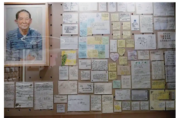
袁隆平离世后，西南大学师生纷纷在雕像前送“信”寄哀思。

此外，最具科普特色的是自然馆，其面积2200平方米，整合西南大学植物保护学院、园艺园林学院、生命科学学院、蚕桑纺织与生物质科学学院以及柑桔研究所等多单