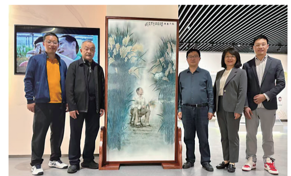
《禾下乘凉梦》捐赠活动

位资源，以“西大之眼 自然之窗”为主题，分“地球往事”“生物演化”“生物万象”“生命共融”“人与自然”“西大故事”等篇章进行展陈。鱼类标本，是西南大学自然馆的馆藏特色之一，一件鲟鱼和两件中华鲟标本，是该馆的“镇馆之宝”。白鲟为中国长江流域所独有，2022年新华社宣布它已在全球灭绝。据介绍，这件标本由西南大学已故鱼类学家施白南教授上世纪70年代采自长江的宜宾段。