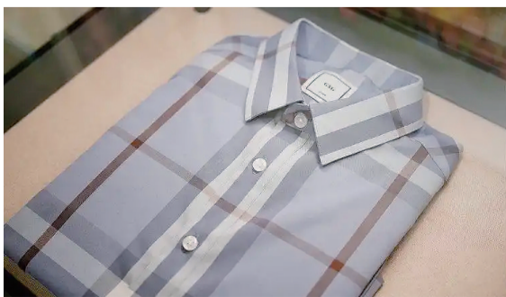
袁隆平夫人捐给纪念馆的袁隆平的衬衫

隆平院士安然坐在稻穗之下，神情温和慈祥，目光轻柔望向沉甸甸的稻穗，满目皆是丰收景象。据悉，1949年，袁隆平考入私立相辉学院（西南大学前身之一）农艺系，立下“让所有人远离饥饿”的毕生追求。袁老生前常说，“人就像种子，要做一粒好种子”。