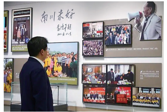
纪念馆很多照片资料都是首次对外展出