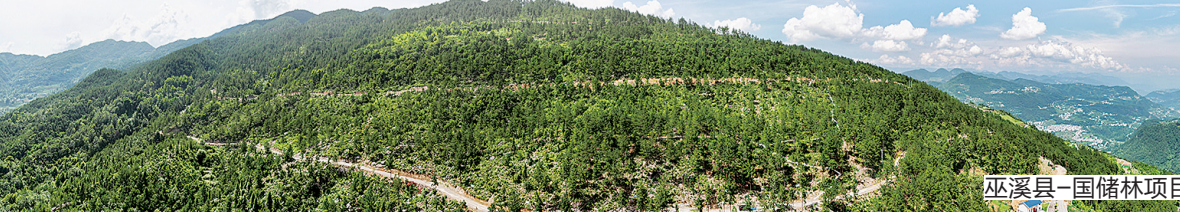
巫溪县-国储林项目