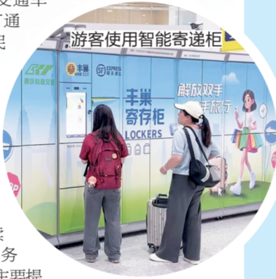
游客使用智能寄递柜