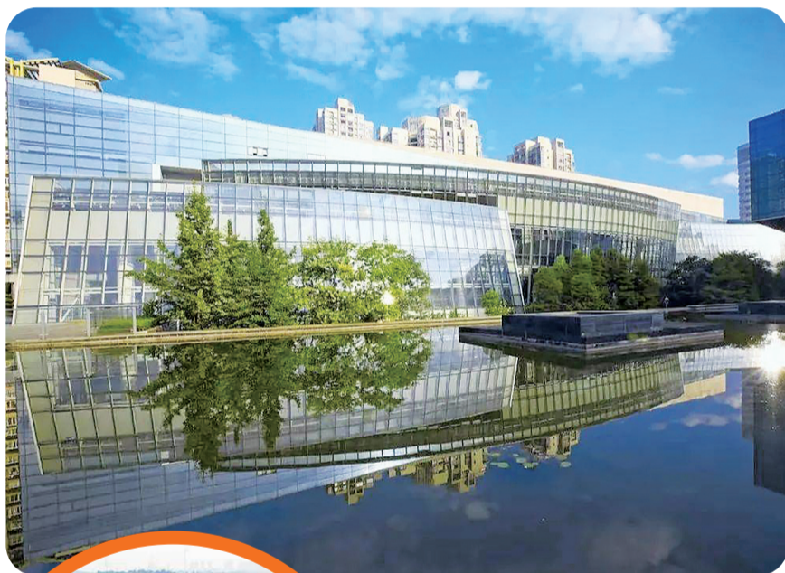
▲重庆图书馆实行全年365天开放

此外,部分“巴·掌书”借阅柜存在设备故障、图书错位等问题,维护响应有时不够及时,部分站点的图书配置与市面上的畅销书没有同步。