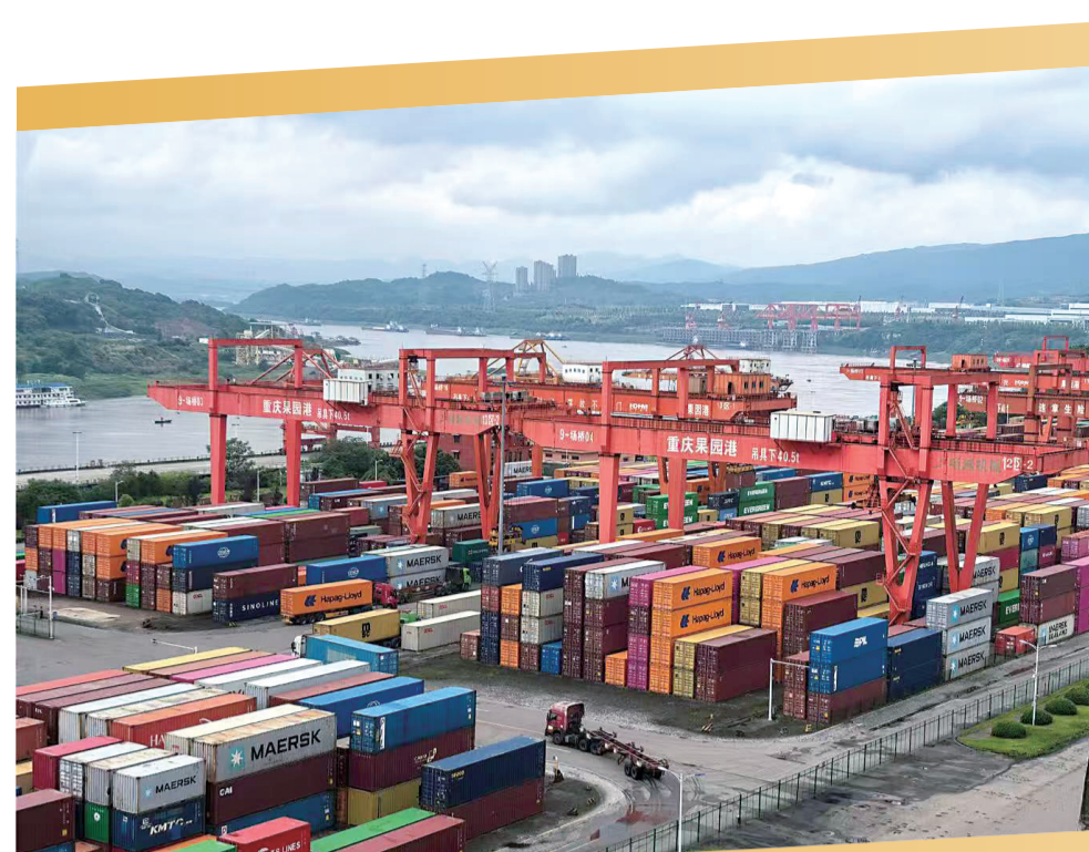
重庆果园港码头一角