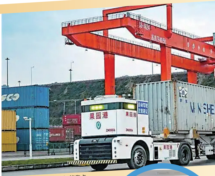
果园港内的无人驾驶智能集卡