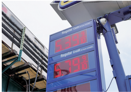
美国纽约的油价牌

《华尔街日报》报道称，伊朗表示愿意暂停铀浓缩活动，但暂停的期限比美国提议的20年时间要短。伊朗还拒绝拆除其核设施。此外，伊朗提议将其部分高浓缩铀稀释，并将剩余部分转移至第三国，但若谈判失败或美国在后续阶段退出协议，第三国须将其归还伊朗。