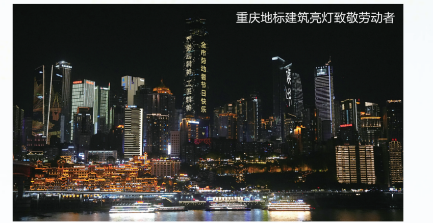
重庆地标建筑亮灯致敬劳动者

除静态的灯光标语外,重庆还运用高科技手段打造了动态的致敬仪式。5月1日晚,“新韵重庆”大型无人机灯光秀在两江两岸的夜空中上演。数千架无人机从弹子石广场腾空而起,在夜幕中精准排列出“给劳动者点赞”等字样,以充满科技感与艺术感的方式,向每一位城市建设者致敬。与此同时,“新韵重庆”大型无人机灯光秀在两江两岸的夜空中上