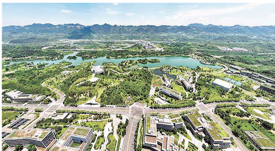
众多高端研发机构坐落在明月湖畔 据新重庆-重庆日报

二是政策保障上拿出真金白银，针对“不愿投、不敢试”等痛点，明确政府投资项目预留不低于5%的预算用于新场景建设，引导金融机构开发“场景贷”“场景保险”，鼓励国有投资基金和社会资本跟投，完善容错免责机制。同时探索空天、频谱轨道等新型要素顺畅流动，提供“沙盒监管”包