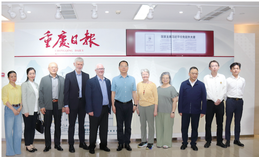
西雅图代表团到访重庆日报报业集团,就推动重庆特色光影文化出海进行了深入交流、讨论。