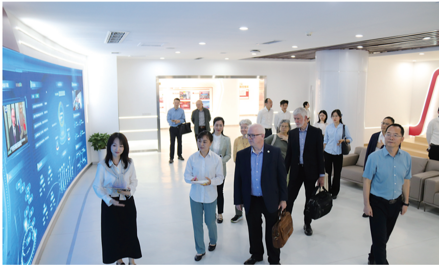
西雅图代表团参观“重庆日报报史馆”