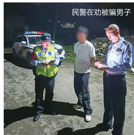
民警在劝被骗男子