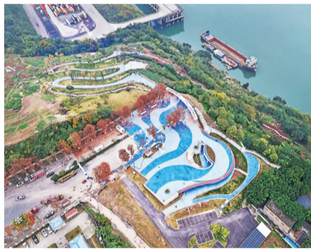
两江鱼复滨江公园

这样的消落带,曾是三峡库区的生态治理难题。但在治理探索中,重庆因地制宜、科学施策,以耐淹绿植修复岸线、分层治理消落带、连片打造滨江公园,让昔日的荒滩、消落带,如今华丽蝶变为四季常青、繁花似锦、游人如织的平湖滨江公园。