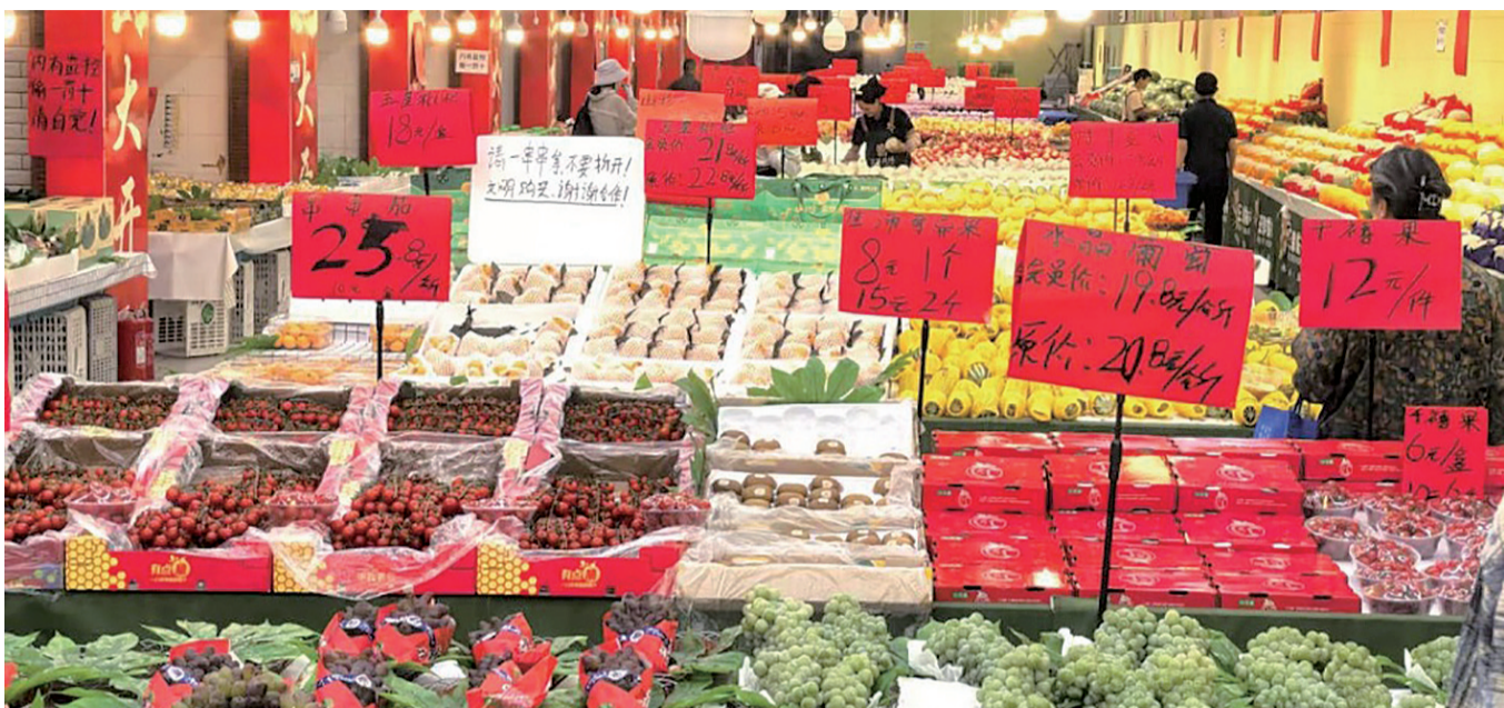
5月22日，云南省昆明市一家新开业的水果商场里品类丰富的时令水果供消费者挑选。 新华网发

值得注意的是，2025年3月14日发布的《食品标识监督管理办法》明确规定，食品标识不得标注“以欺骗、误导、夸大等方式作虚假描述”的内容。