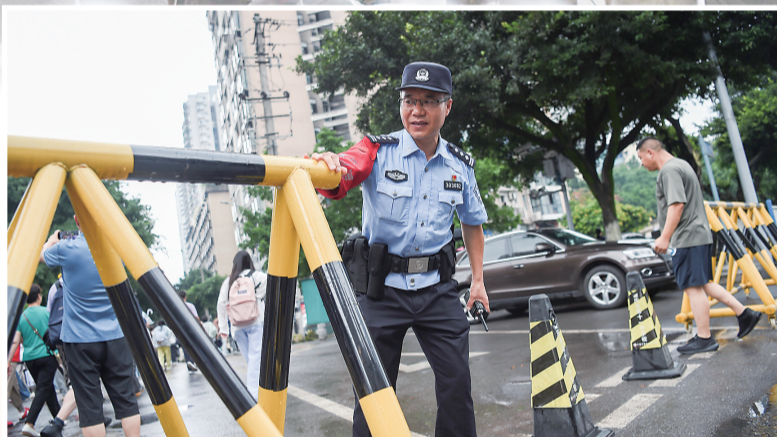
南岸区公安民警反复检查考点外防冲撞设施