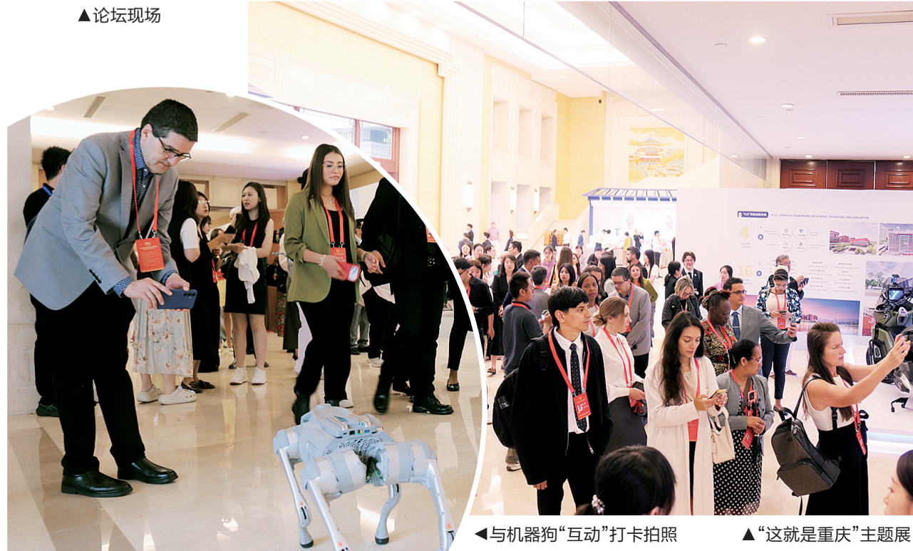
◀与机器狗“互动”打卡拍照