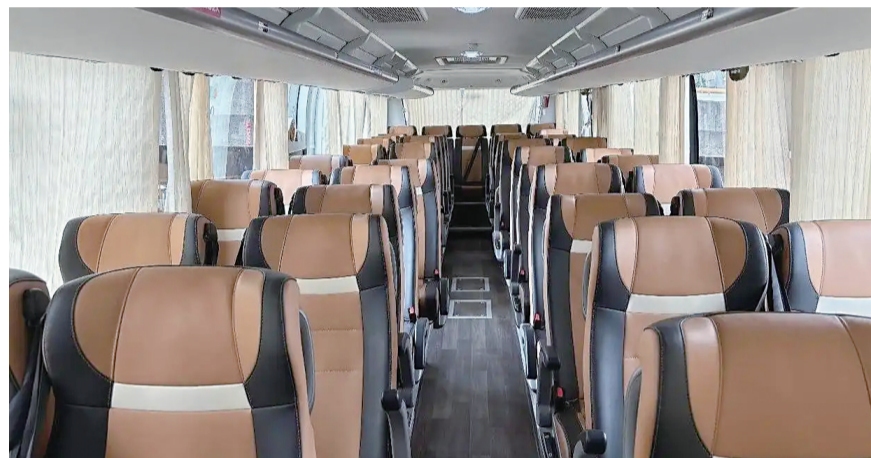
成渝便民快巴车厢

成都前往重庆方向:依次停靠地铁牛市口站(地铁2号线A1、A2口之间)、五桂桥公交站、迎晖路中站(地铁7号线迎晖路站C口仁仁富大酒店对面);