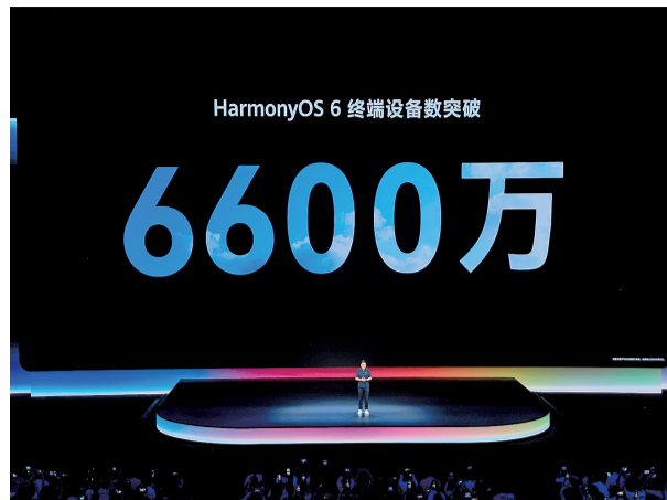
娱乐应用、精品应用、海外应用和元服务等也日新月异,让鸿蒙生态的创新势能奔腾不息。 文/图 顾立

从6600万台设备,到40万款应用与服务;从千行万业的加速创新,到全球开发者的纷至沓来——鸿蒙将舞台交给伙伴,把能力开放给每一位开发者。历经两年多携手共建,鸿蒙生态实现从“可用”到“好用”“爱用”的跨越,各领域应用创新持续突破。除了各类常用应用外,游戏应用、影音