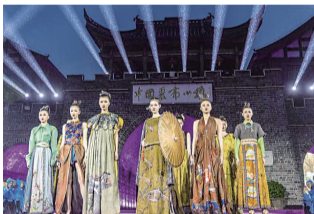
荣昌夏布走秀在中国夏布小镇举行 (资料图)