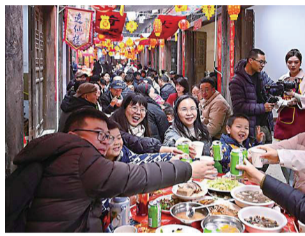
江津中山古镇千米长宴

从一镇一宴的烟火气，到千亿产业的沸腾图景，从年货市集的人头攒动，到四季不断的消费热潮——重庆非遗美食，就这样热腾腾、香喷喷地带着乡愁走进了千家万户的日常。