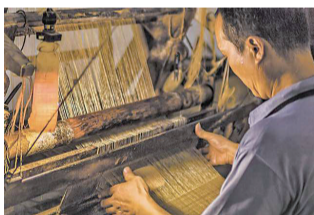
荣昌夏布织造技艺

“文化和自然遗产日”是国务院设立的文化建设主题日，时间为每年6月的第二个星期六，旨在提高全社会对文化遗产和自然遗产的保护意识。