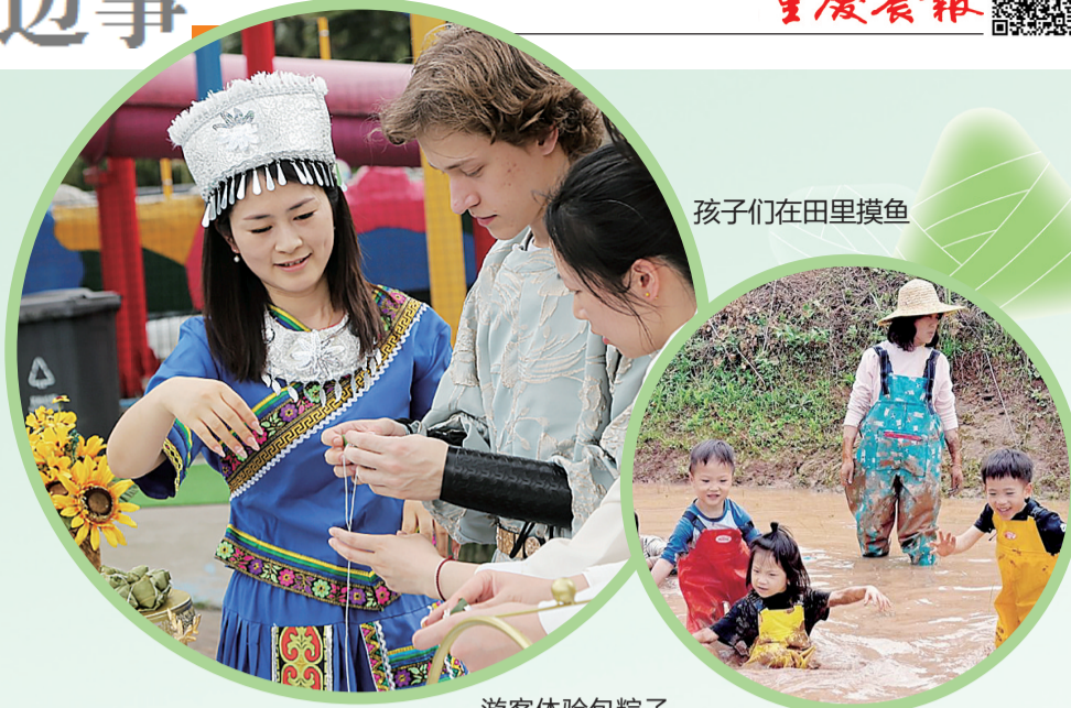
孩子们在田里摸鱼